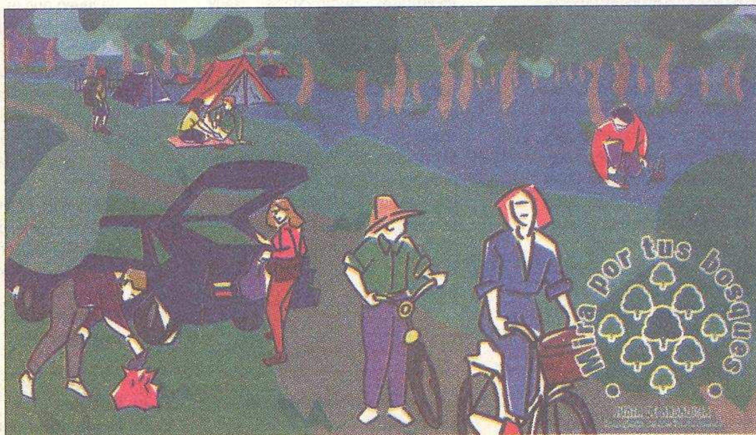
Compromiso por los bosques de Andalucía

Este mensaje no será el mismo para todos, en el futuro se hará incidencia en la conservación del medio forestal en el que se encuentran inmersos, por lo que en el caso de las zonas urbanas, se incidirá en el crecimiento de un