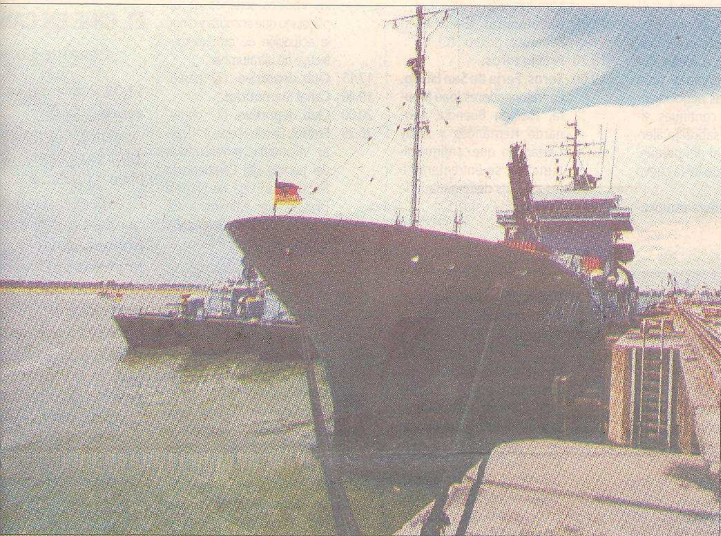
trulleras de la Armada alemana tienen 58 metros de eslora, ocho de manga y tres de calado.

Armada germana permanecerán ancladas durante muelle de los minerales del puerto de Huelva