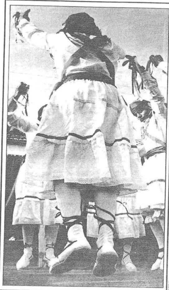
FIESTAS La mayor parte de nuestros rituales festivos lo seguimos haciendo "para nosotros".

desde hace ya tres lustros. Parecería lógico que ante el reconocimiento de que poco se puede hacer —sea ello cierto o no— en un campo tan complejo y "globalizado" como el de la economía —mucho se hubiera hecho para avanzar en el segundo de los objetivos prioritarios estatutariamente definidos: el afianzamiento de la conciencia de identidad andaluza , a través de una actuación seria y constante, con los presupuestos adecuados a la importancia de la prioridad definida, en las tres vías de la investigación, la difusión y la interiorización de conocimientos por parte de los andaluces de los valores de los también tres ámbitos: el histórico, el cultural y el lingüístico, que el Estatuto señala como ejes para la profundización de nuestra conciencia andaluza. En este terreno apenas pueden aducirse dificultades u obstáculos exteriores: la Junta de Andalucía tiene prácticamente traspasadas todas las competencias en Educación y en Cultura. ¿Se ha avanzado mucho en esto desde aquel, ya lejano en el tiempo, 28 de febrero de 1980, que coronó la breve pero muy intensa etapa histórica abierta el 4 de diciembre del 77? Vayamos por partes, siquiera sea sintéticamente. ¿Están los programas de EGB y de Enseñanzas Medias enfocados al afianzamiento de la conciencia de identidad andaluza de las más jóvenes generaciones, aquellas que no vivieron esos años? Sólo en broma la